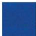
Expostyle 0824 ROYAL BLUE Pantone 7687C