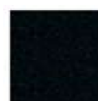
Expostyle 0910 BLACK Pantone black C