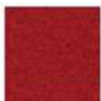
Expostyle 0962 THEATRE RED Pantone 7620C