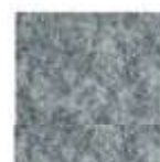
Expostyle 0985 LIGHT GREY Pantone Cool grey 5C